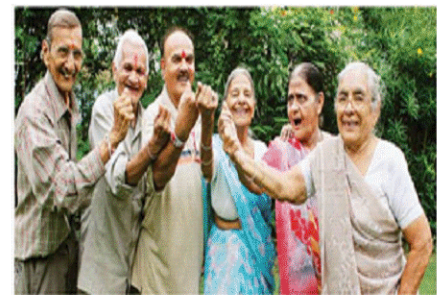
Atal Vayo Abhyuday Yojana 2023

(A) अटल वयो अभ्युदय योजना भारत में वरिष्ठ नागरिकों सशक्त बनाने के उद्देश्य से एक व्यापक पहल है। इसे सामाजिक न्याय और अधिकारिता मंत्रालय द्वारा पेश किया गया था। यह योजना बुजुर्गों द्वारा समाज में किए गए अमूल्य योगदान को मान्यता देती है और उनकी भलाई एवं सामाजिक समावेश सुनिश्चित करना चाहती है।